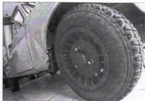
Équipée de pneus "désert", la 4L est prête. Aucun grain de sable ne devrait bloquer les rouages du beau projet de l'équipage 1623.

Nouveaux amortisseurs, nouveaux roulements à gaz avant et arrière, double ventilateur pour refroidir le moteur, deux filtres à essence, deux filtres à air, des sièges baquet de Mégane, des jantes de Renault 5 Alpine... Les demoiselles ont acheté les pièces détachées grâce à l'argent de leurs 26 sponsors et un garagiste du secteur a réalisé les réparations gracieusement.